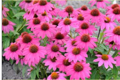
Echinacea purpurea 'PowWow Wild Berry' s'est hissée au palmarès des gagnantes 2011, malgré le fait qu'elle soit une vivace. Doublement exceptionnelle!