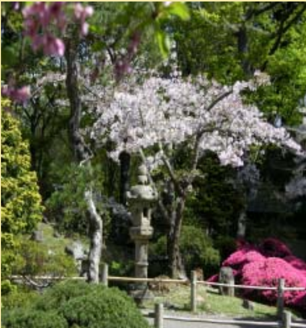
Photographie d'un jardin japonais prise au Golden Gate Park à San Francisco au printemps 2007