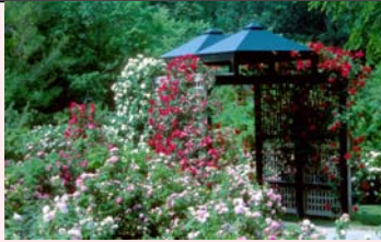
Roseraie du Jardin botanique de Montréal

Horticultrice responsable de la roseraie du Jardin botanique de Montréal depuis vingt ans, Madame Laberge est également juge pour les expositions de roses au Canada et à l'étranger depuis presque aussi longtemps.