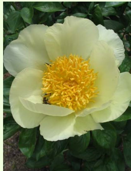
Magnifique pivoine à fleur simple qui se tient bien sous la pluie.

Elle nous racontera l'histoire des pivoines, nous parlera de leur provenance, de l'étalement des floraisons. Elle nous fera faire un survol des pivoines qu'elle cultive.